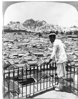
구한말 북촌 한옥들