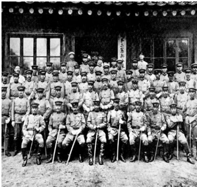
무단 통치기 일본 헌병 정치