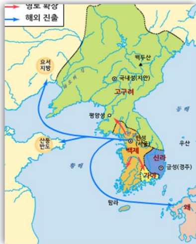
4 세기 백제의 전성기