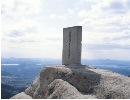
서울 북한산 진흥왕 순수비