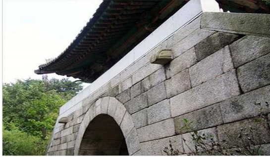
북진정책을 했던 근초고왕 요새였던 북한산성