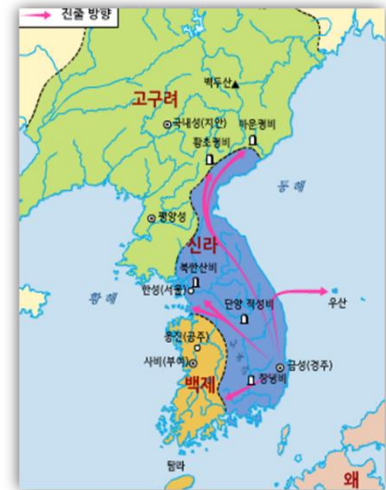
6 세기 신라 전성기