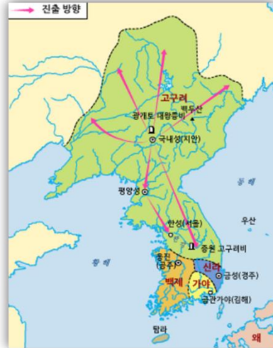
5 세기 고구려 전성기