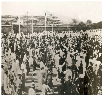
전국적으로 일어난 만세 운동