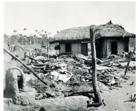
일본의 3·1 운동에 대한 보복으로 일어난 제암리 사건. 일본은 마을 주민들을 교회에 몰아넣고 불태웠다.