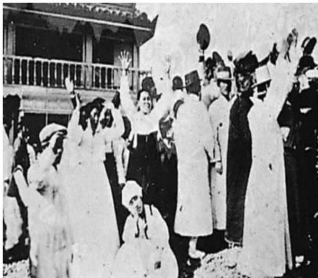
종로 탑골 공원에서의 만세 운동