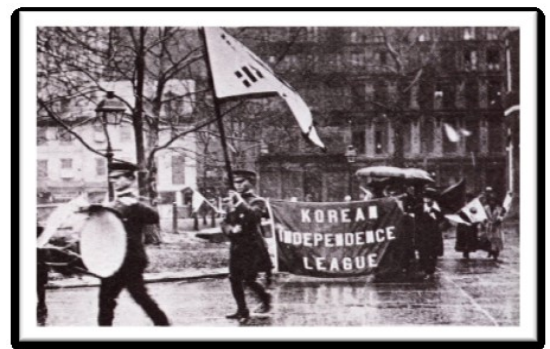
1919년 4월 한인자유대회 시가행진