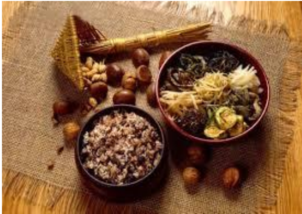
오곡밥과 묵은 나물