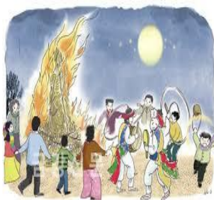
달맞이와 달집 태우기